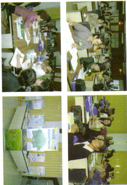
ภาพกิจกรรม

ชำระเงินค่าลงทะเบียน จำนวน 4,500 บาท (สี่พันห้าร้อยบาทถ้วน) หมายเหตุ : วช. ขอสงวนสิทธิ์ในการไม่รับลงทะเบียนผู้ที่กรอกข้อมูลไม่ครบถ้วน